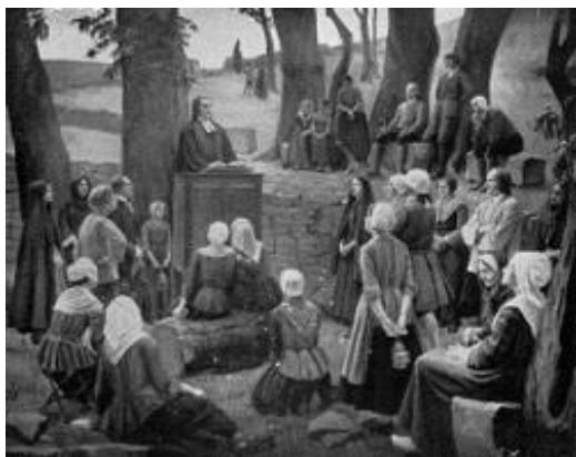
Assemblée du Désert

Juifs et Protestants, parcours croisés 1517 – 2017